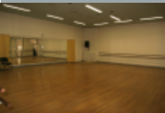
Studios de Danse