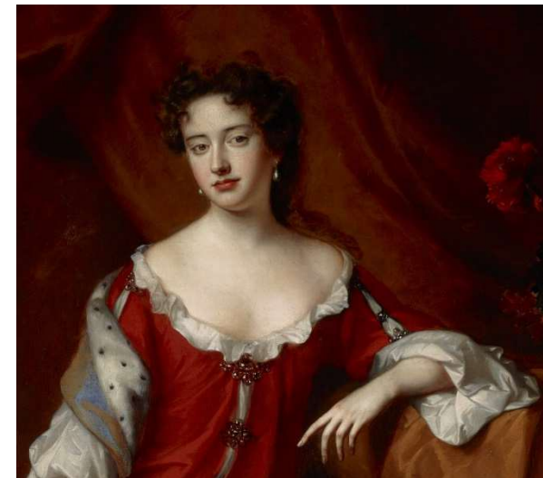
Queen Anne im Alter von 20 Jahren