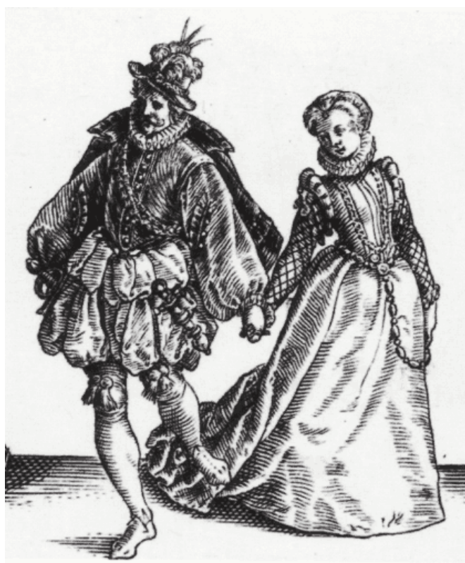
Christoph Murer, Der Ball, 2. Hälfte 16. Jhdt.