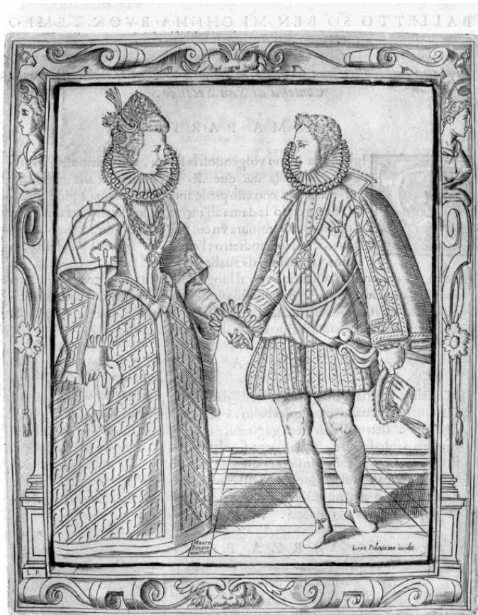
Negri, Gratie d'Amore 1602, Bild zum Balletto „So ben mi ch'ha bon tempo“