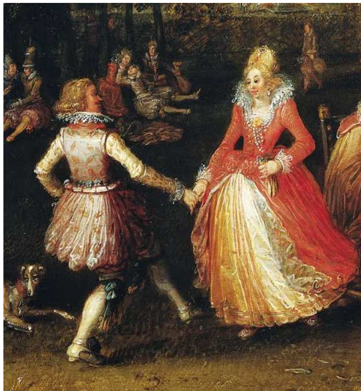
David Vinckboons, De buitenpartij