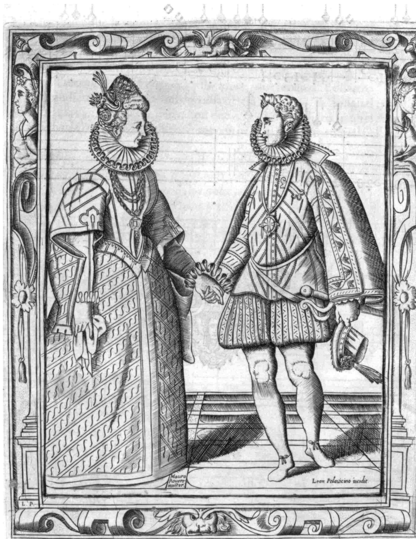
Negri, Gratie d'Amore 1602, Bild zum Balletto „Alta Mendoza“

Veranstalterin: Jadwiga Nowaczek. Die Teilnehmerzahl ist auf 40 beschränkt.