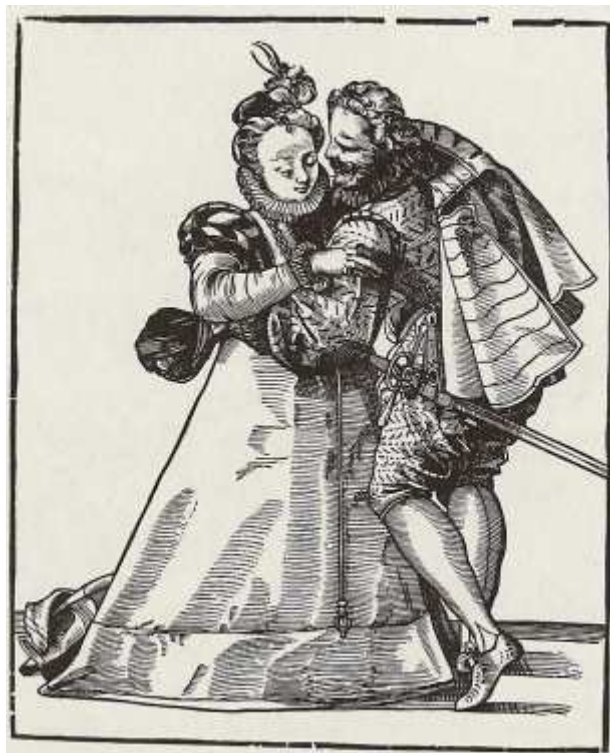
Christoph Murer, Der Ball, 2. Hälfte 16. Jhdt.

„Zum heiteren Leben lädt Amor uns ein ...“