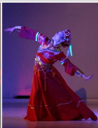
Impressionen Tanztage 2012