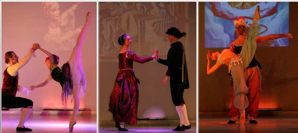
Impressionen Tanztage 2012

Tel.: +43 676 6621184 E-mail: info@tanz-tage.at Web: www.tanz-tage.at